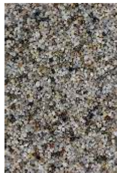
RKK 01 Szary rzeczny drobny