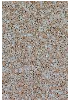
RKM01 Jasny beż

Greinplast RSK - daje możliwości kreatywnego zaprojektowania i wykonania na powierzchni tarasu czy balkonu, różnego rodzaju wzorów. Pozwala na to dostępny wachlarz kolorów i rodzajów kruszyw znajdujących się w ofercie firmy. Naturalne kruszywo stosowane w systemie posadzkowym daje gwarancję trwałości koloru.