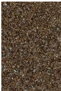
RKM 03 Brąz