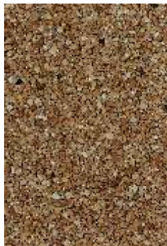
RKM 02 Terakota