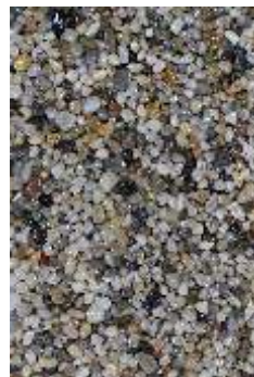
RKK 02 Szary rzeczny