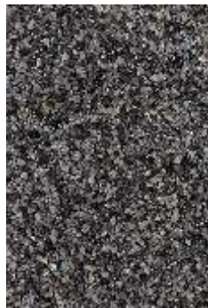
RKM 04 Szary